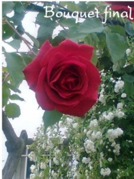
A Jean Jaures et à Rosa Luxemburg

Le muguet au bois fou ce matin carillonne, Ses clochettes enivrées qui bourdonnent et fredonnent, Comme autant de rappels de nos lûtes passées, Fratricides et victoire contre l'ordre emmuré.