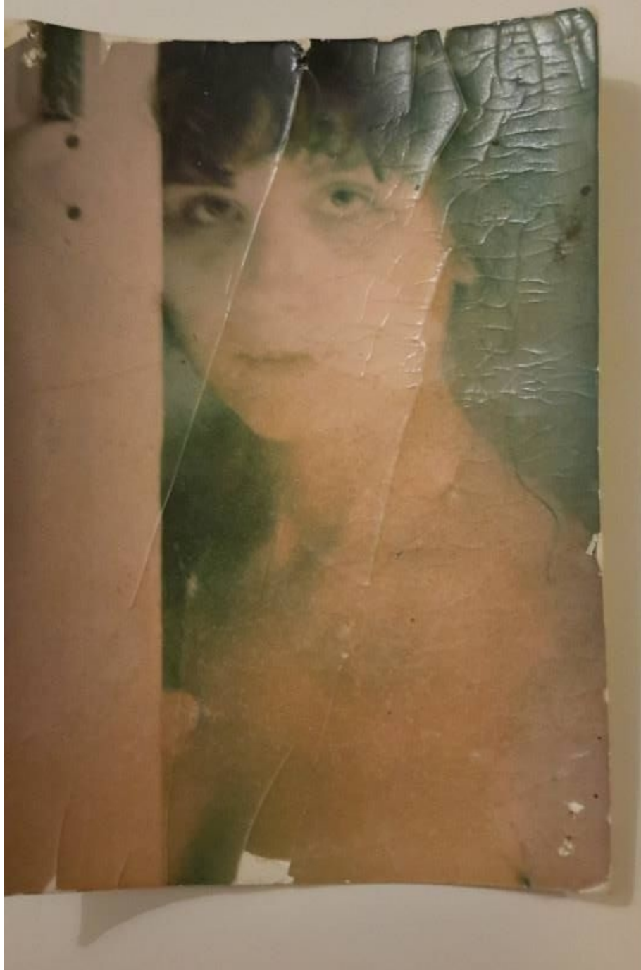
Un voyage immobile...